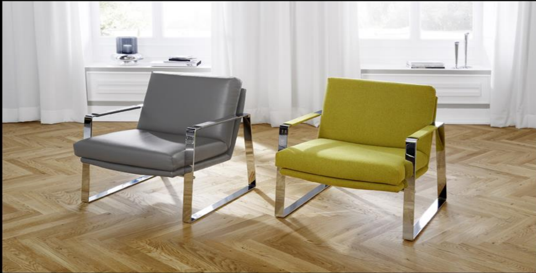
Einzelstuhl im Bezug Leder Touch grey und Musterstoff