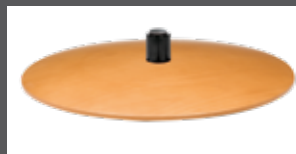
Holzteller in mehreren Farben