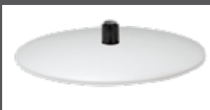
Bezogener Teller (Leder oder Stoff)