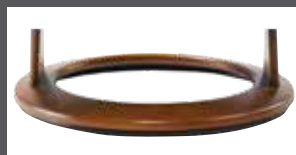
Holzdrehring in mehreren Farben