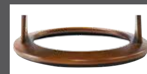
Holzring in mehreren Farben