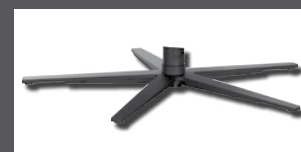
Metall-Sternfuß verchromt Edelstahl-optik oder pulverbeschichtet anthrazit