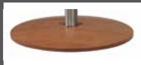
Drehteller aus Holz