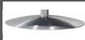
Drehteller in Edelstahloptik

(bei Leder sind aus technischen Gründen Nähte im Bezug!)