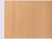
Buche natur Dessin genuine beech melamine