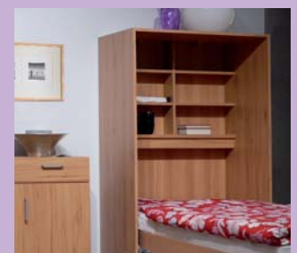
Praktisches Bett-Innenregal: Das Lieblingsbuch sofort griffbereit!

Arrange the Venga moduls according to your own taste: For living and sleeping in one room. Modern and timeless.