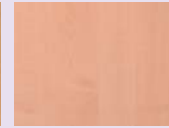
Ahorn Dessin maple melamine