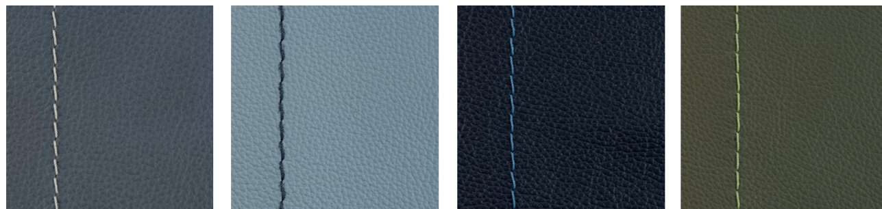
azuro sky pazific zypresse