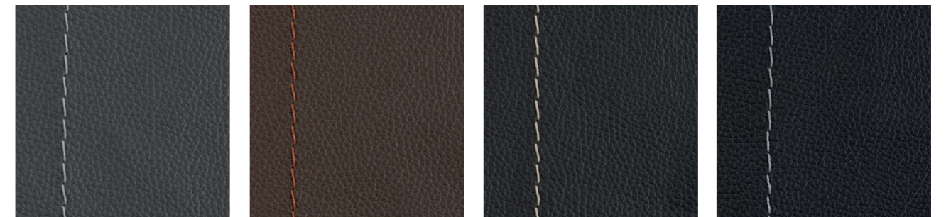
zinn erde kaffee nacht

HINWEIS: Die Darstellung der Muster ist aus technischen Gründen nicht farbverbindlich und dient nur als Übersicht. Bitte wenden Sie sich an unsere Partner im Möbelfachhandel, hier finden Sie unsere aktuelle Leder- und Stoffkollektion.