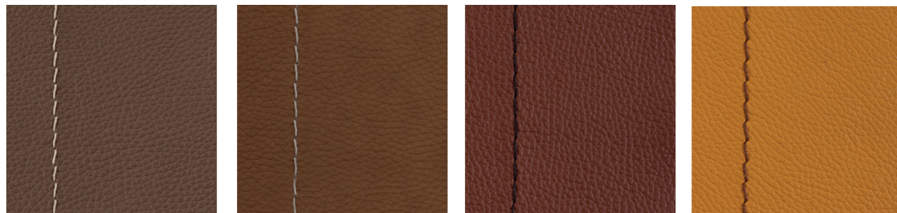
ranger texas sierra safran