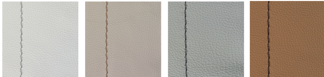
zucker nebel silber bambus