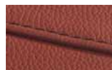
DARK BROWN 1002