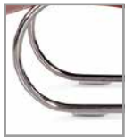
Freischwingergestell Chrom glänzend