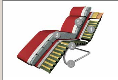
Das Design des hier abgebildeten Querschnitts entspricht nicht dem Modell dieses Katalogblattes.