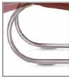
Freischwingergestell silber pulverbesch.