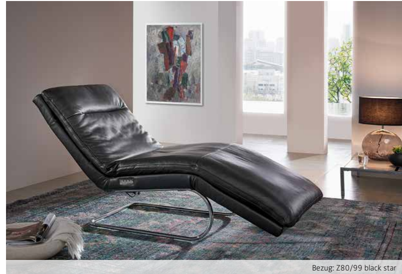
Bezug: Z80/99 black star