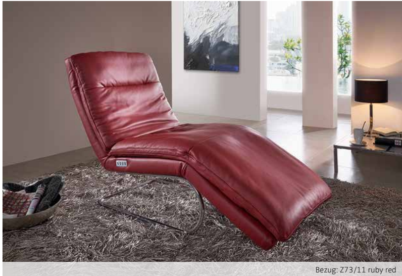
Bezug: Z73/11 ruby red